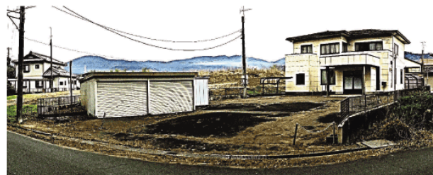
図面と現況が相違する場合は現況優先とします。