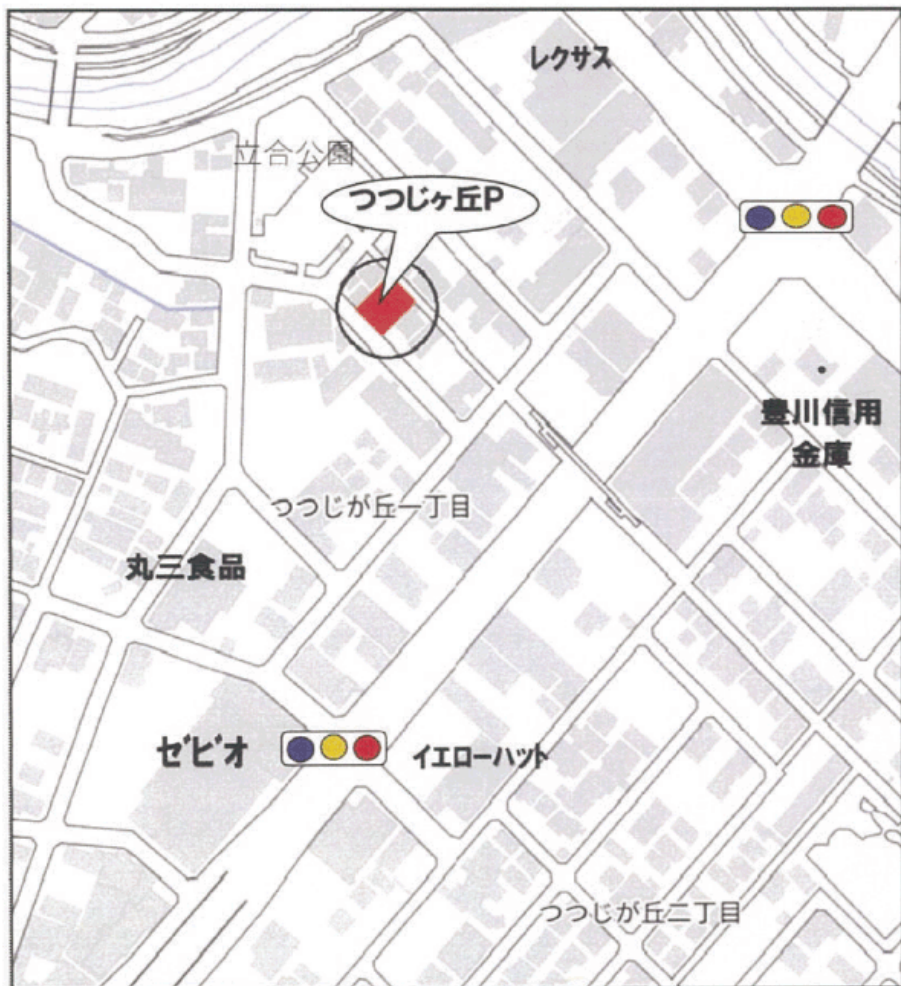
■上記地図は国土地理院地図を加工して作成しています。